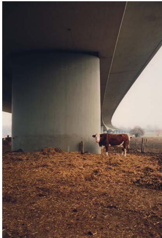
→ Jitka Hanzlová: o. T., zwei Bilder aus der Serie ‚Hier‘ 1998 und 2005-10.