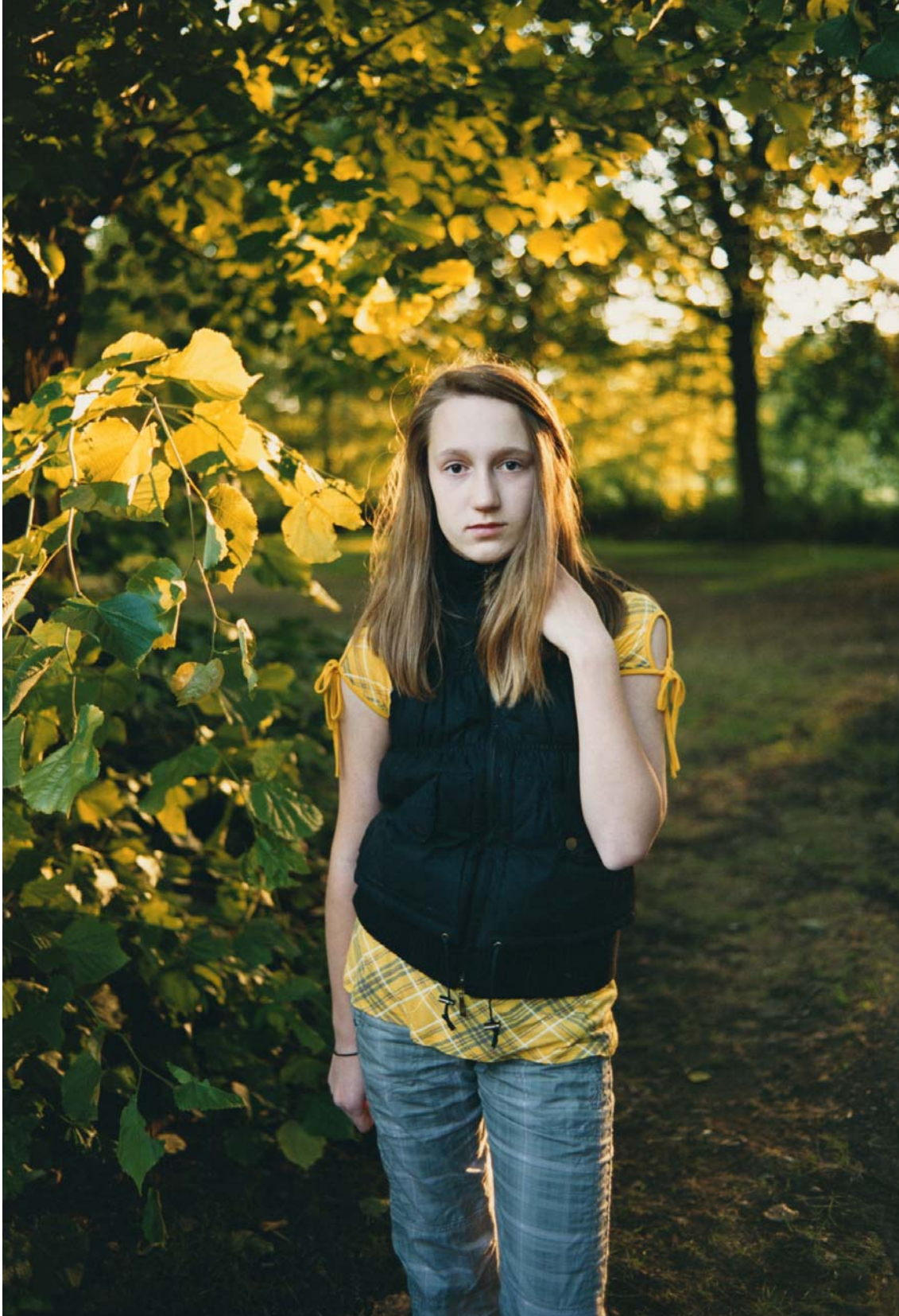
→ Jitka Hanzlová: o. T., aus der Serie ‚Hier‘ 1998 und 2005-10.