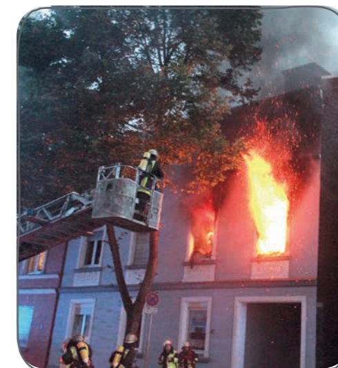
Am Brandort muss die Feuerwehr vieles gleichzeitig erledigen.

Los geht's! Nach 60 Sekunden sitzen alle mit Ausrüstung in den Fahrzeugen. Noch während der Fahrt legen die Feuerwehrleute ihre Atemschutzgeräte an.